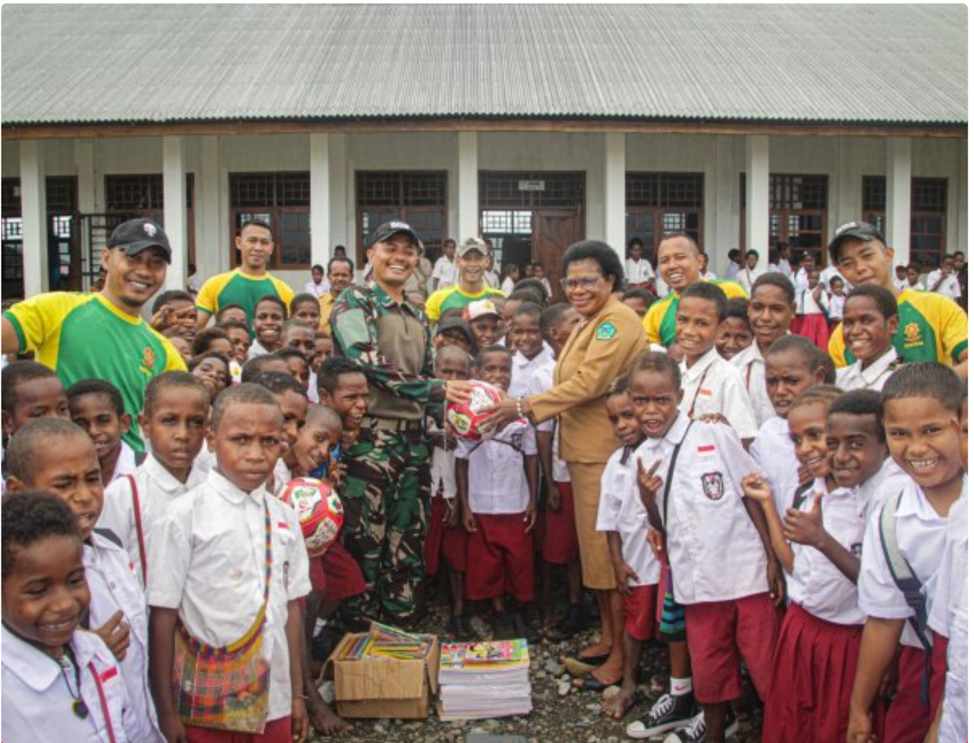
Foto: Satgas Pamtas Mobile RI-PNG Yonif 503/Mayangkara mendistribusikan sarana belajar ke SD Gabungan Distrik Kenyam, Kabupaten Nduga, Papua, pada Minggu (09/02/2025).

NDUGA- Dalam upaya mendukung pendidikan di daerah perbatasan, Satgas Pamtas Mobile RI-PNG Yonif 503/Mayangkara mendistribusikan