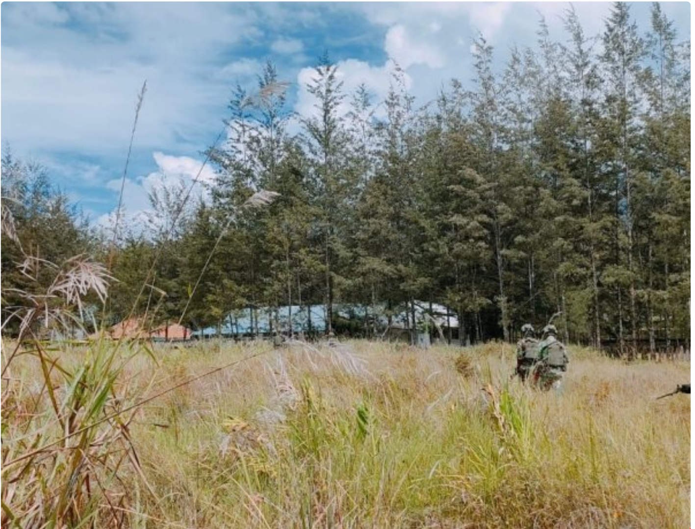
Satgas Yonif 323 Amankan Anggota OPM terduga pelaku tindak Kriminal

Satgas Mobile Yonif 323/Buaya Putih Kostrad berhasil menangkap salah satu anggota Organisasi Papua Merdeka (OPM) yang diduga terlibat dalam sejumlah tindak kriminal di wilayah Papua, Kabupaten Puncak, Penangkapan ini dilakukan