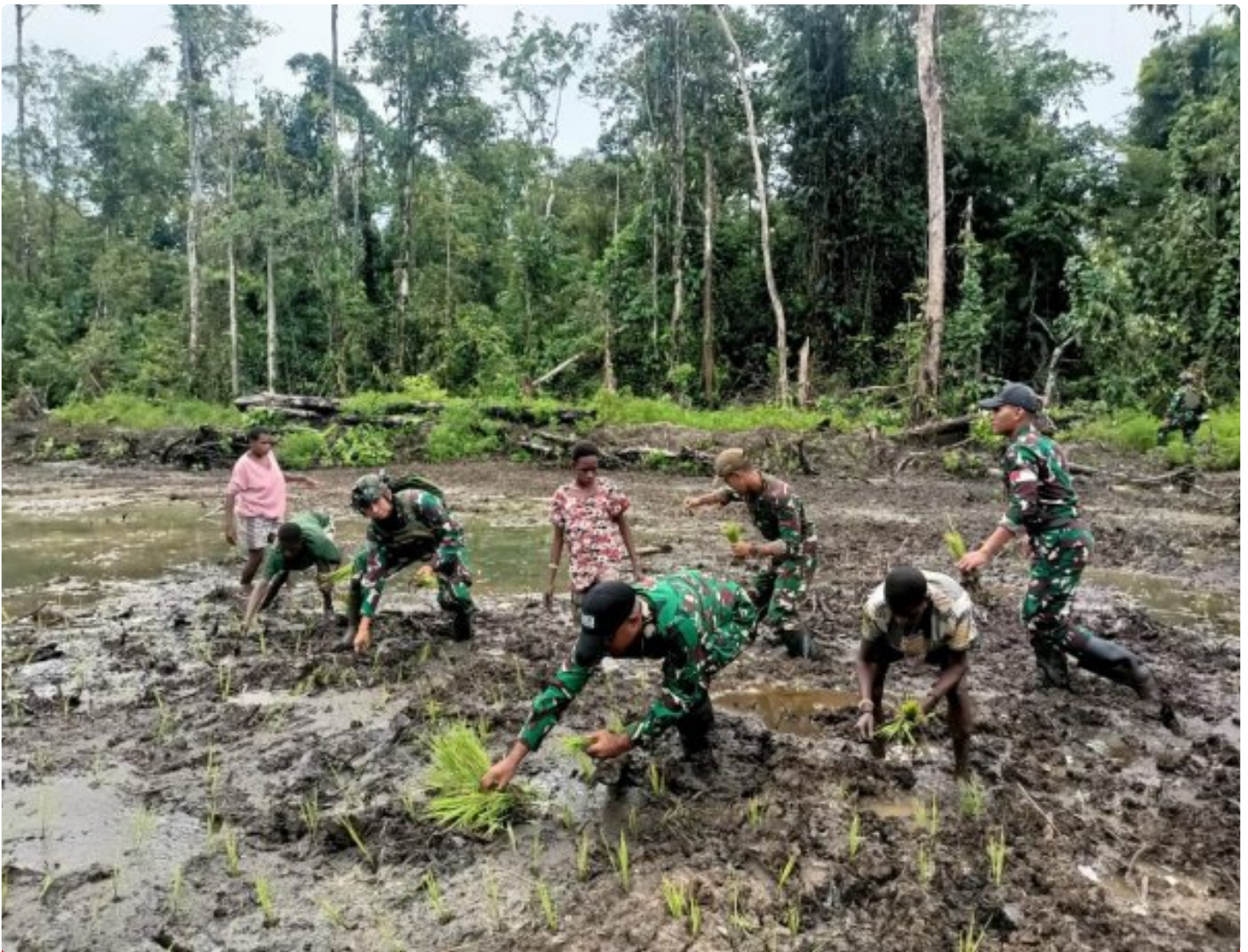
Foto: Satgas Pamtas Mobile RI-PNG Yonif 503/Mayangkara menggagas program ketahanan pangan yang melibatkan langsung warga Kampung Mumugu, Distrik Krepkuri, Kabupaten Nduga, Selasa (07/01/2025).

NDUGA- Dalam upaya membangun kesejahteraan masyarakat di wilayah penugasan Papua Pegunungan, Satgas Pamtas Mobile RI-PNG Yonif 503/Mayangkara